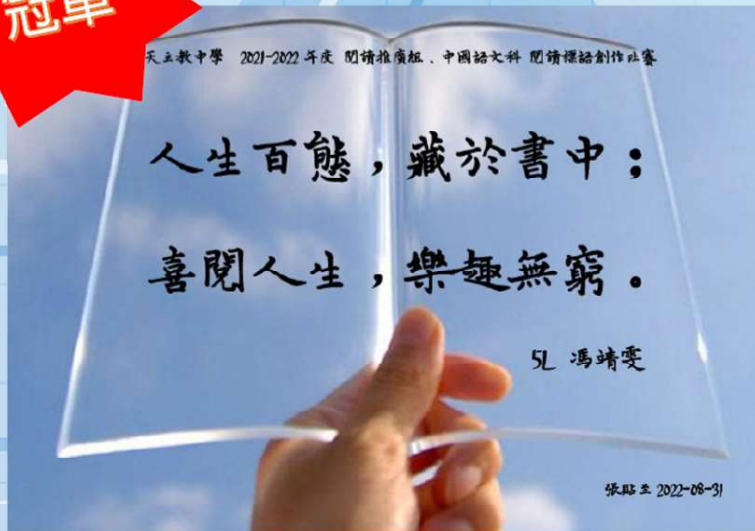
冠軍 5L 馮靖雯 人生百態，藏於書中；喜閱人生，樂趣無窮。