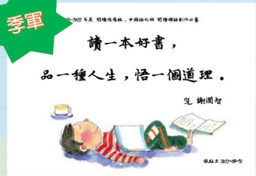
季軍 3L 謝潤智 讀一本好書，品一種人生，悟一個道理。