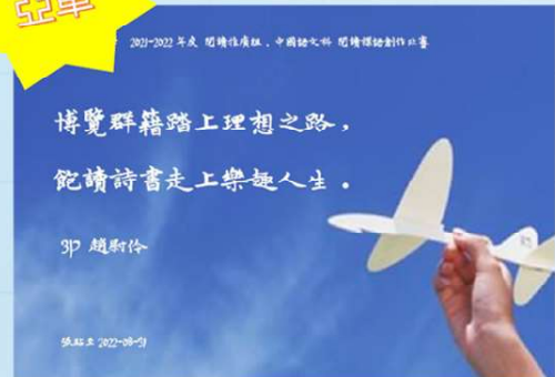
亞軍 3P 趙尉伶 博覽群籍踏上理想之路，飽讀詩書走上樂趣人生。