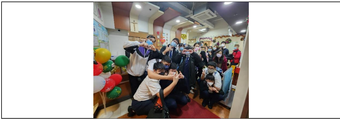
樂訊團清潔聖伯多祿聖保祿聖堂