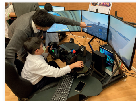
校內學習模擬飛行駕駛