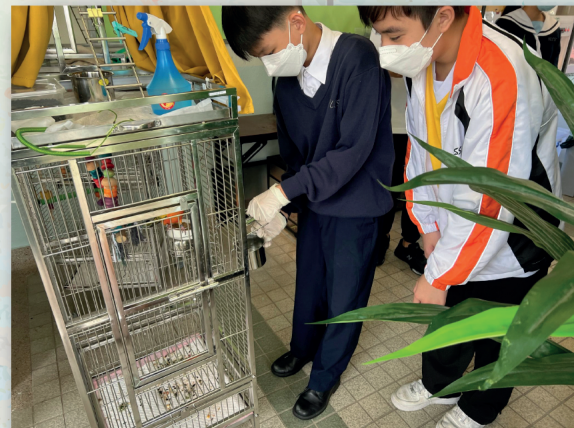
生物保育員照顧鸚鵡的起居飲食