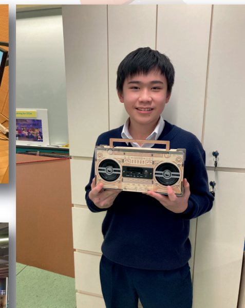
同學成功自製一部藍牙收音機