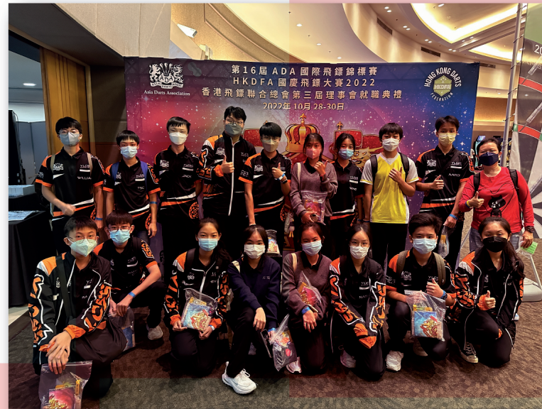
第16屆ADA國際飛鏢錦標賽