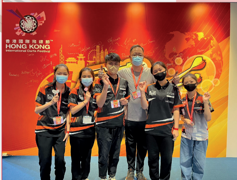
第四屆香港國際飛鏢節學界盃 (中學)