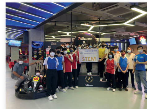
校外學習模擬跑車駕駛